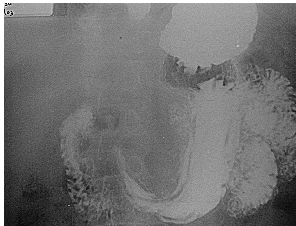
Figura 2. Seriada esófago-gastro-duodenal.