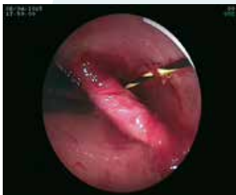
Figura 4. Se muestra el LigaSure (flecha) introducido profundamente en el divertículo, que fue lo que produjo la perforación.