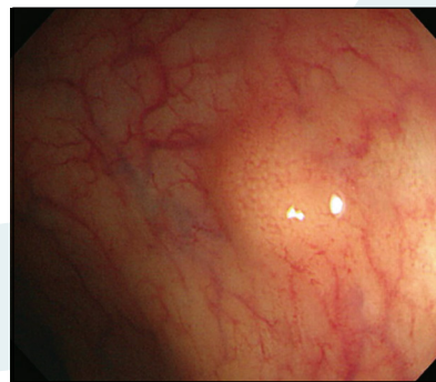
Figura 2. Tumor carcinoide rectal.